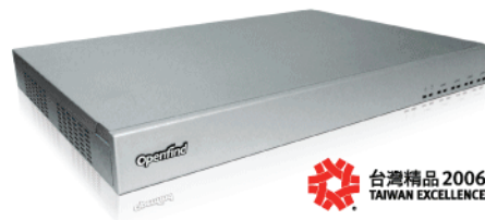
Openfind™ MAILGATES Appliance

Openfind MailGates Appliance 是一款結合郵件系統防護、內容過濾、政策稽核、統計報表與系統備援機制的全方位郵件防護閘道器。為提供更全面且完整的郵件安全防護機制，MailGates 重裝打造雙核心郵件防護系統，整合「內容過濾」與「行為分析」兩大防護機制，協助企業郵件防護再升級。MailGates 獨家自行研發的 Mail2000 MTA 核心，針對台灣地區郵件使用行為提供在地化的分析技術。此外，更每月自動偵測並蒐集分析全球 30 億封以上的信件樣本，不受限於其變化多端的樣貌，透過分析郵件發送行為即能有效阻攔任何語系的垃圾信，確保訊息溝通無國界。