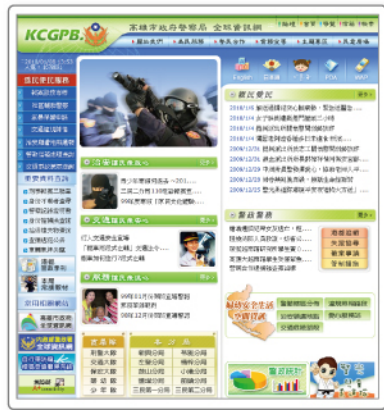
▲ 高雄市政府警察局網站

高雄市政府警察局（以下簡稱高雄市警局）於 1945 年正式成立，下設各科、室、中心共 16 單位分別掌理相關事項，總編制（不含借調人員）超過 3 千人，透過建立優質廉能的團隊來負責轄區內各項工作，同時各單位積極善用電子郵件系統、全球資訊網、人事差勤、公文系統等資訊科技工具讓對民服務益加便捷有效率。為統籌內部資源與對外服務，高雄市警局由資訊室全責提供警政資訊系統規劃與發展、電腦軟體硬體設施操作、管理與維護、資訊教育訓練與諮詢服務及其他資訊處理事項。